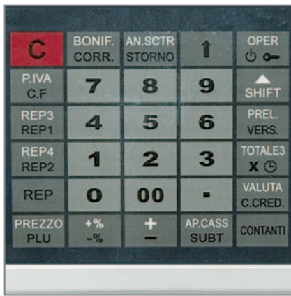
TASTIERA A MEMBRANA