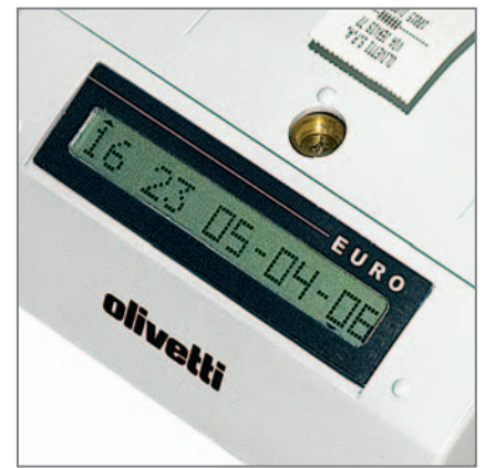
DISPLAY LCD RETROILLUMINATO